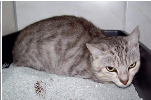
Er wurde zusammen mit Tigger (oben) zurückgelassen.