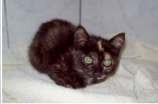
- Sarah - Fundkatze aus Speicher. Sie ist sehr wahrscheinlich schon vermittelt.