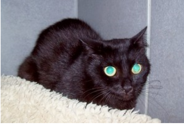
- Annabelle. Wohnungskatze, deren Besitzer verstorben ist.

Besitzer sehr leid, da ihre alte Katze gerade überfahren wurde und sie sich deshalb für zwei Wohnungskatzen entschieden haben. Jetzt kommt zu dieser Trauer auch noch der Verlust von Boomer und die Angst um Stella. Wir haben natürlich die Behandlungskosten für Stella übernommen und hoffen das Beste. Obwohl die Seuche erst bei den neuen Besitzern ausgebrochen ist, haben wir bei uns alles desinfiziert und geputzt. Alle Tiere sind fit und so sind wir nicht betroffen.