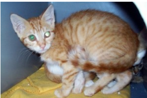
- Die drei kleinen, sind aus der Fangaktion aus Orsfeld und noch etwas scheu